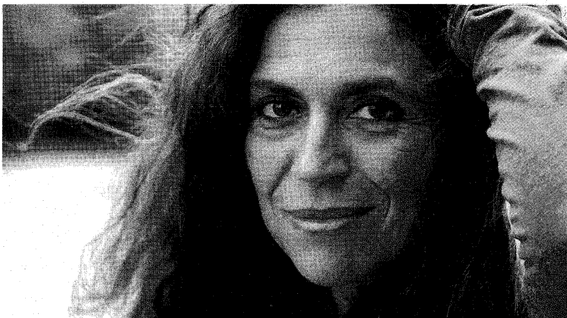
Savina Yannatou zet de muzikale rijkdom van Griekenland weer positief op de kaart.